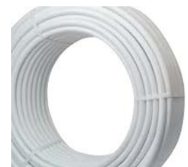
TRESSE PVC BLANCHE