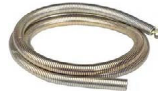
RESSORT DE CINTRAGE