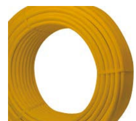
TRESSE PVC JAUNE