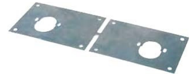
PLATINE DE FIXATION